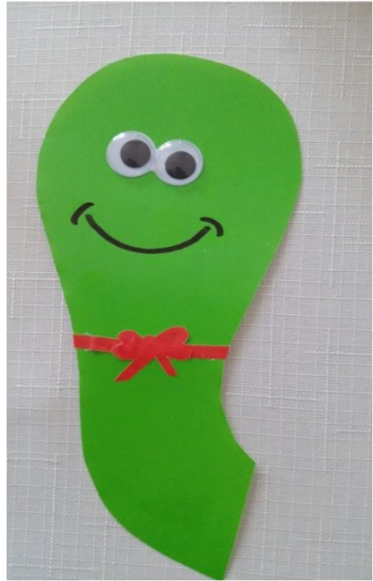
Wykonujemy główkę gąsienicy.