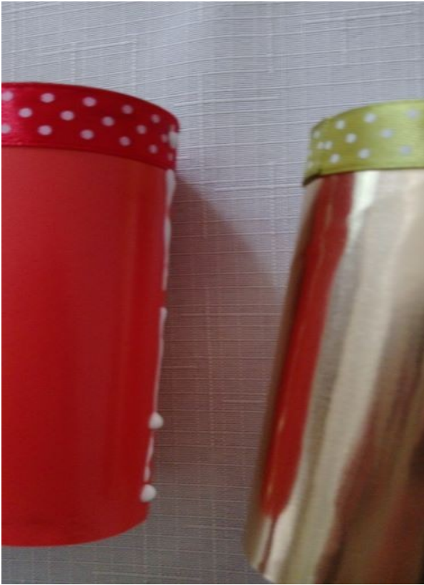
Sklejamy rolki ze sobą.